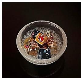
Mixed Bell Cube Cheese ミックスベルキューブチーズ