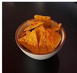
Nacho Chips ナチョスチップス