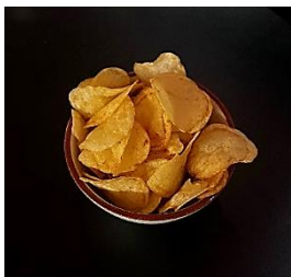
Potato Chips ポテトチップス