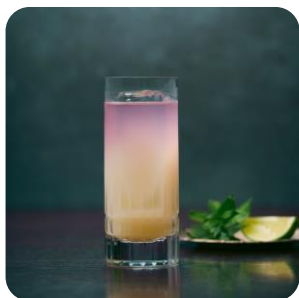
- FUGA - 風雅