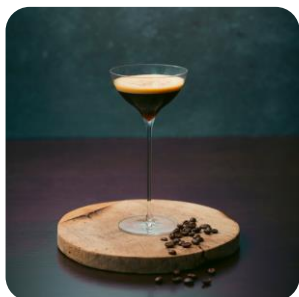
- Kaffee Kantata - コーヒー・カンタータ