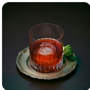
- Goldberg - ゴルトベルク