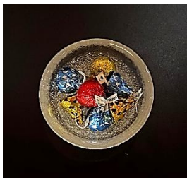
Mixed Kiss Chocolate ミックスキスチョコ