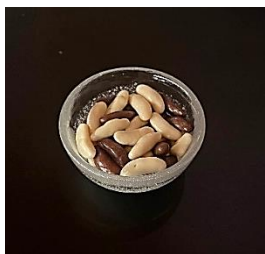
Mixed Chocolate Kakinotane ミックスチョコ柿の種